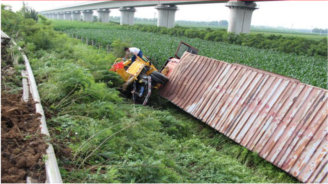
(图 1: 两车相撞后翻至高速公路护栏外的护坡下)