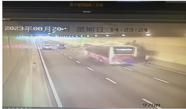
图 2 图 3 图 4 车辆相撞前后监控录像截图