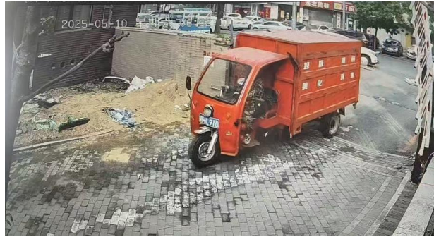
图 2 朱某才驾驶车辆进入事发园区

8 时 00 分前，工友张某梅看到朱某才坐在沙发上，问“怎么了”，朱某才说“我累了”，大概 20 分钟后，看到朱某才躺在沙发上，但是张某梅没在意，以为他累了休息呢。