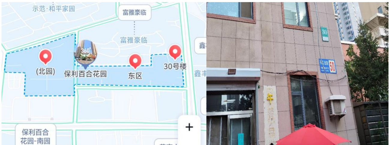
图 3 事故位置及周边情况示意图

事故发生地点：沈阳市铁西区兴工北街 52 号保利百合花园东区 30 号楼（兴工北街 50 号）单元门前区域。