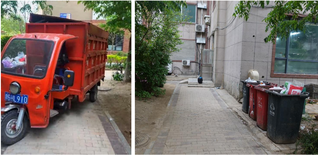
图4 事故发生后垃圾车停止位置示意图